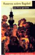
"ROSTROS SOBRE BAGDAD", Algar (2008)