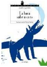
"LA LUNA SABE A COCO", GRUPO ANAYA (Madrid, 2008)