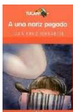
"A UNA NARIZ PEGADO", EDEBE (Barcelona, 2007)