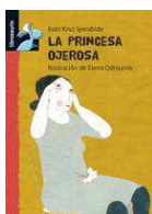
"LA PRINCESA OJEROSA", MACMILLAN HEINEMANN (Madrid, 2009)