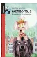
"QUERIDO TOLO", MACMILLAN HEINEMANN (Barcelona, 2007)