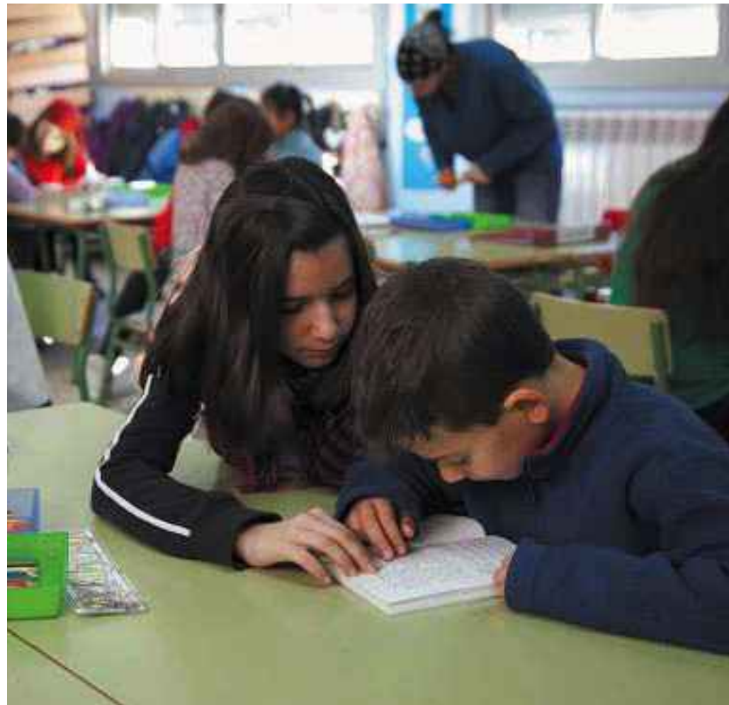
Dos alumnes de l'escola Sant Josep-El Pi llegeixen un llibre durant una classe