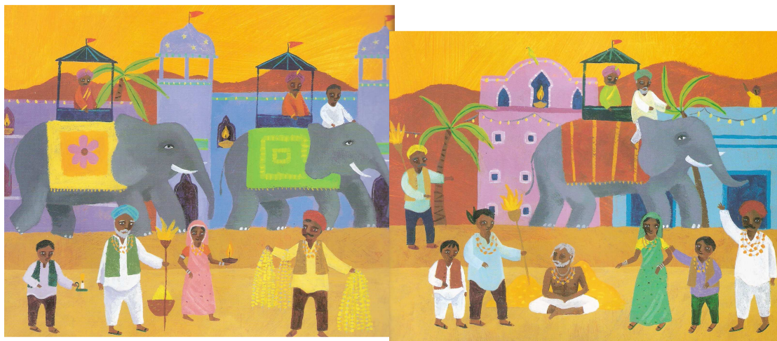
IMATGE DEL LLIBRE "EL BALL DE L'ELEFANT" ON ES REPRESENTA LA FESTA DEL DIVAALI

Convé que els elefants, les persones i les cases tinguin les mateixes mides, perquè el mural quedi més autèntic.