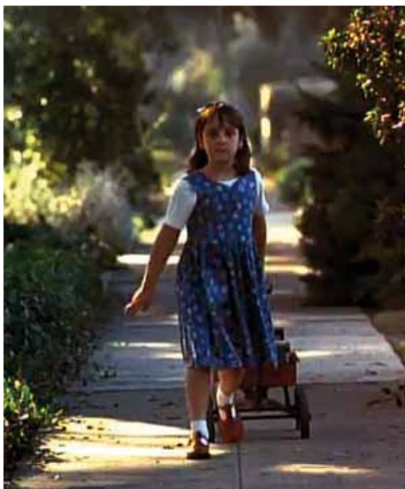
Escena de la película.

El personaje de Matilda es un icono de la literatura infantil y forma parte del imaginario de muchas personas que a través del libro o de la película descubrieron un ser maravilloso, una niña inteligente, decidida y encantadora que sobrevive a una familia