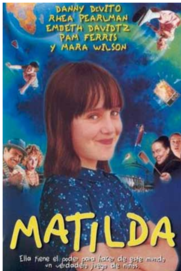
Cartel de la película.

La cinta comienza con el nacimiento de Matilda. Una voz desconocida nos va explicando los progresos de esta niña prodigio. Nos cuenta, por ejemplo, que “al cumplir los dos años Matilda ya había aprendido lo que la mayoría de la gente aprende a los treinta: a cuidar de sí misma”.